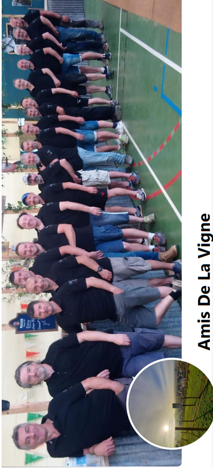
Amis De La Vigne

Avant de commencer, un grand merci à l'association les amis de la vigne Qui nous accueille aujourd'hui !